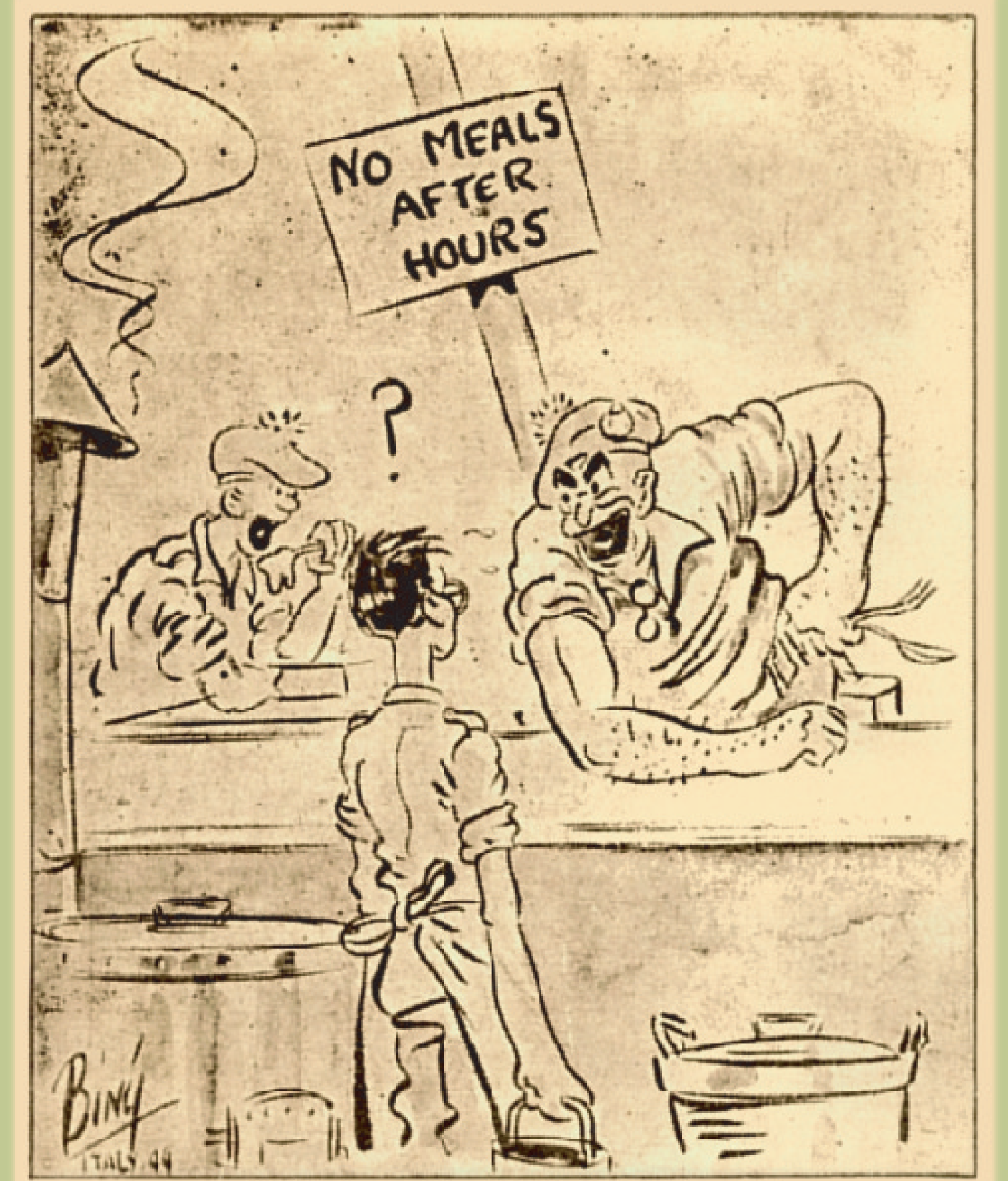
" Look, Sonny Boy, DO I or DON'T I eat ? "