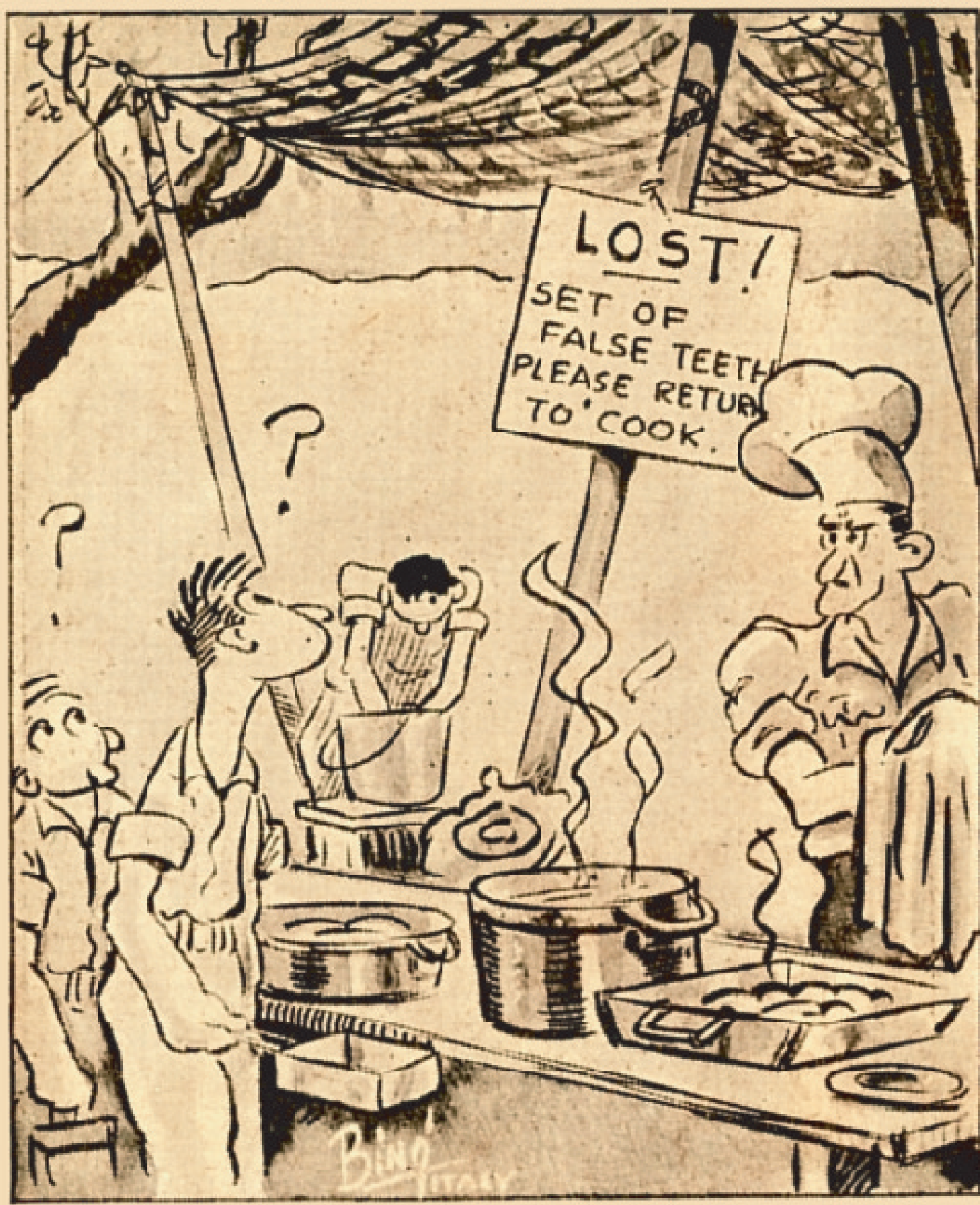
" Well ? "

PERSA DENTIERA. PREGASI RIPORTARLA AL CUOCO.