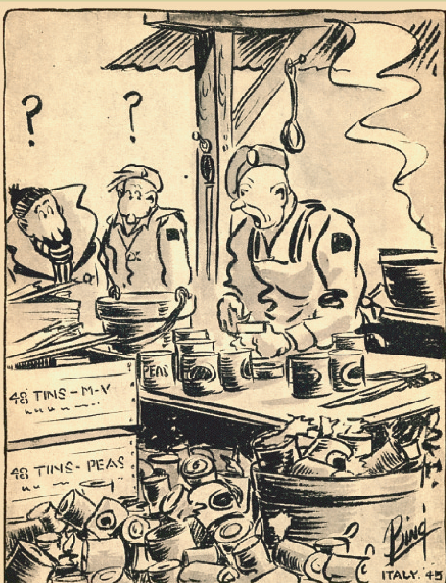
" Four years ago when I joined up, I knew nothing about cookin' ! "

" Quattro anni fa quando mi sono arruolato, non ne avevo un'idea di come si cucina ! "