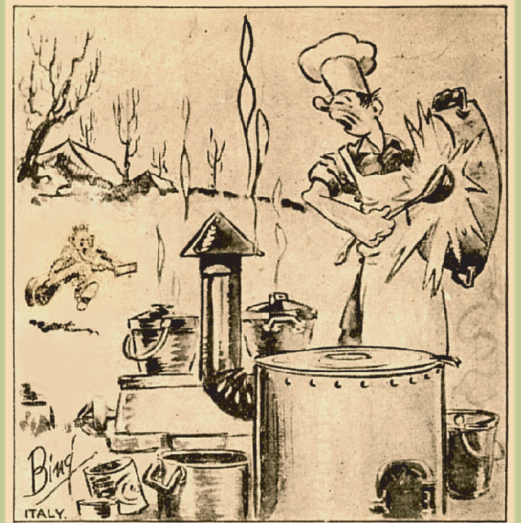
" For all those who don't like bully beef, supper's over ! "

" Per tutti quelli che non amano la carne in scatola, la cena è finita ! "