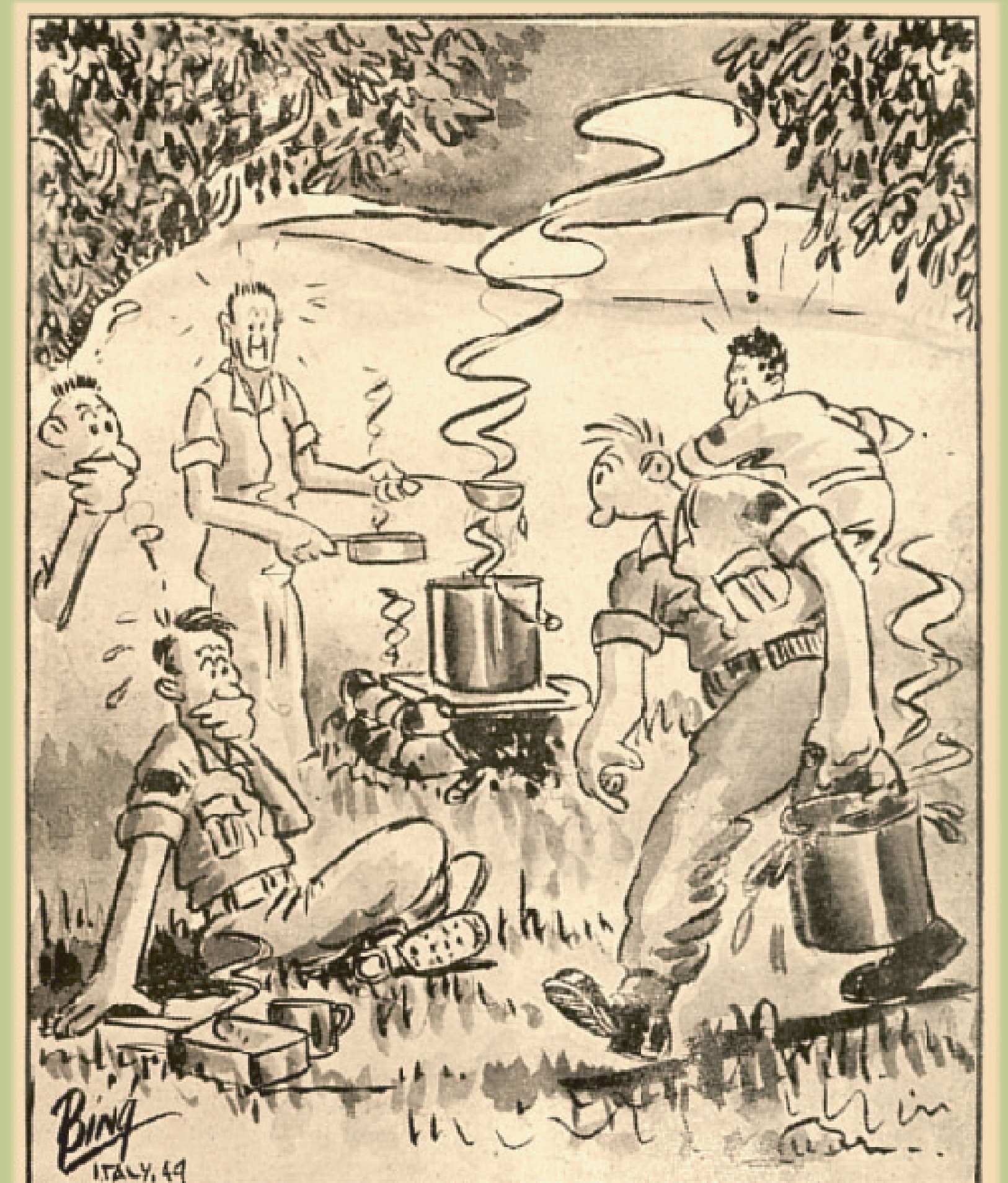
" Here's the stew. Where's the pail I had my socks soakin' in ? "

" Quattro anni fa quando mi sono arruolato, non ne avevo un'idea di come si cucina ! "